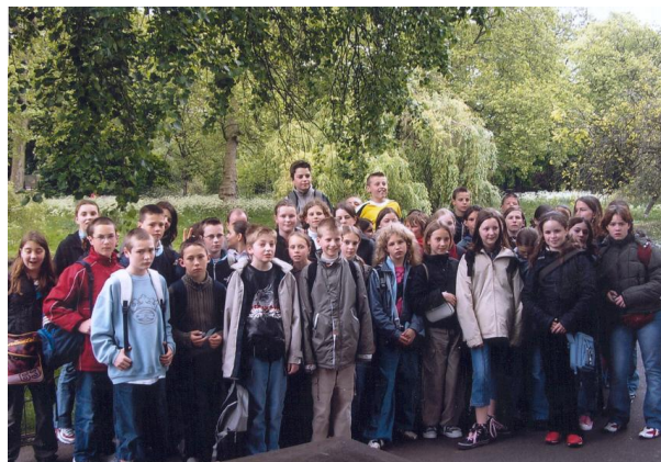
Angleterre (Classes de 6 ème / 5 ème )