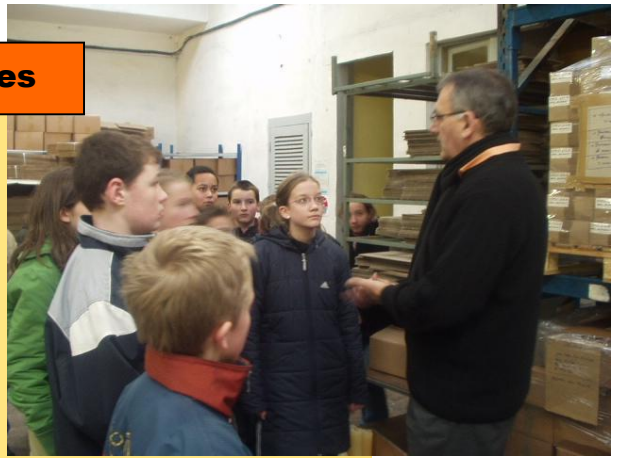
Technologiques (Visite d'entreprises)