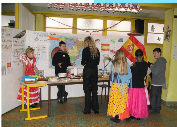
La matinée "Portes ouvertes"