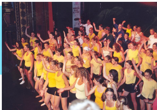
Le spectacle de fin d'année