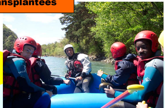
Semaine « Sports en eaux vives »