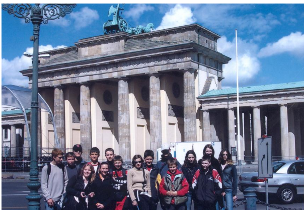
Allemagne (Classes de 4 ème / 3 ème )