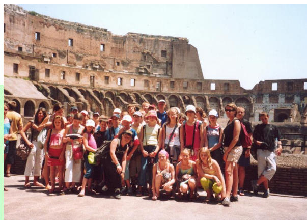
Rome (Classes de 6 ème / 5 ème )